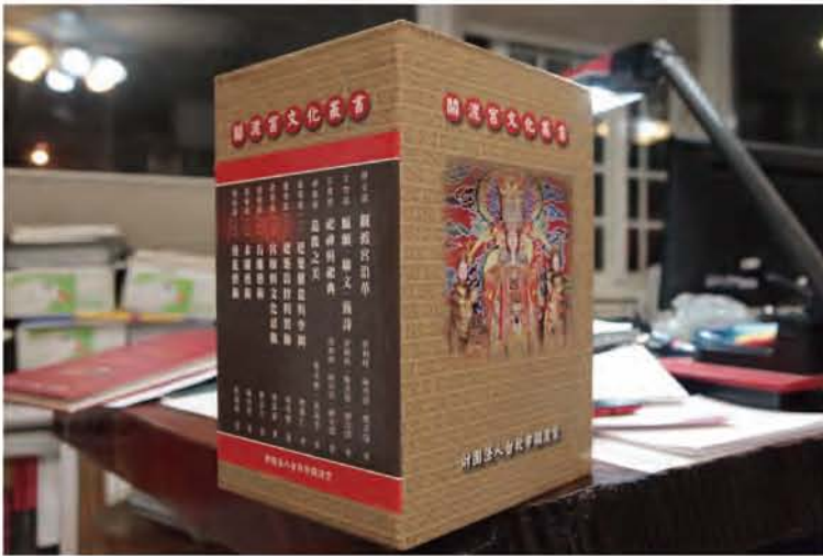
圖2 關渡宮文化叢書10本封套