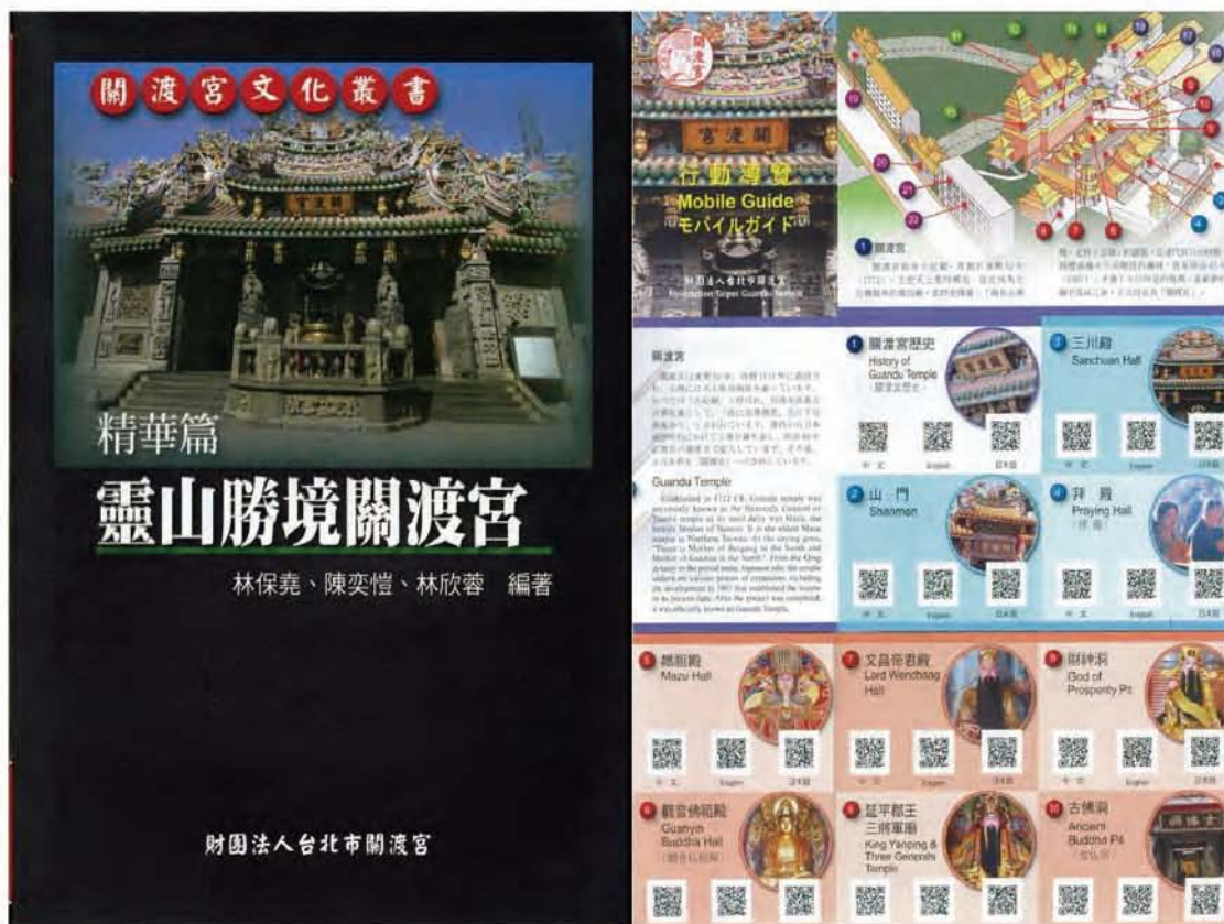
圖4 《精華篇—靈山勝境關渡宮》 (第11本)

開展其下三篇共七本的撰寫作業。至於執行作業的「攝影與繪圖」、「撰寫與印製」，則是另有工作群負責處理。